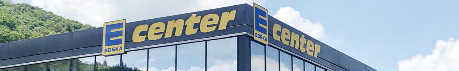
EDEKA E-Center Eichstätt

Die Anteile an diesem Spezial-AIF dürfen nicht an Anleger vertrieben werden, die keine professionellen oder semi-professionellen Anleger sind